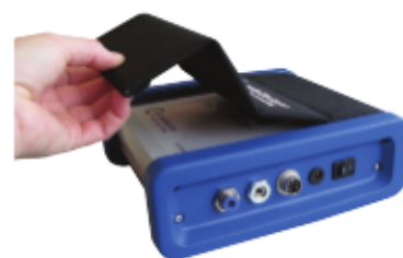
Couvercle pratique incluse