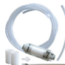
Flexible de mesure (pièces individuelles)