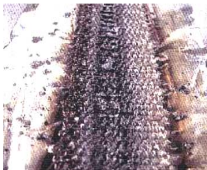
Pour mémoire, aspect du ruban envers brûlé après soudage

En conclusion, le ruban envers est une alternative à l'inertage (avec une qualité légèrement dégradée) quand l'inertage est difficile à mettre en œuvre.