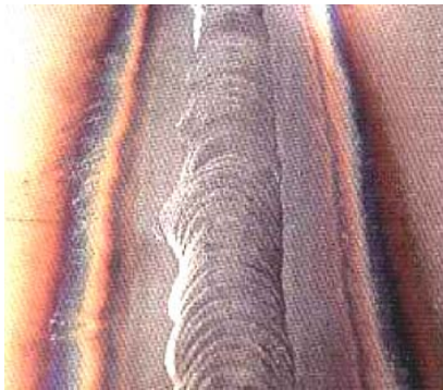
A GAUCHE : Aspect du cordon endroit soudé