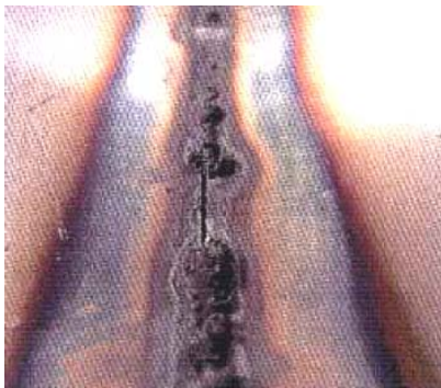
A GAUCHE : Cordon envers (pénétration) sans ruban de protection ni gaz d'inertage : à noter la présence de rochage (oxydes noirs se présentant sous forme de petits rochers)